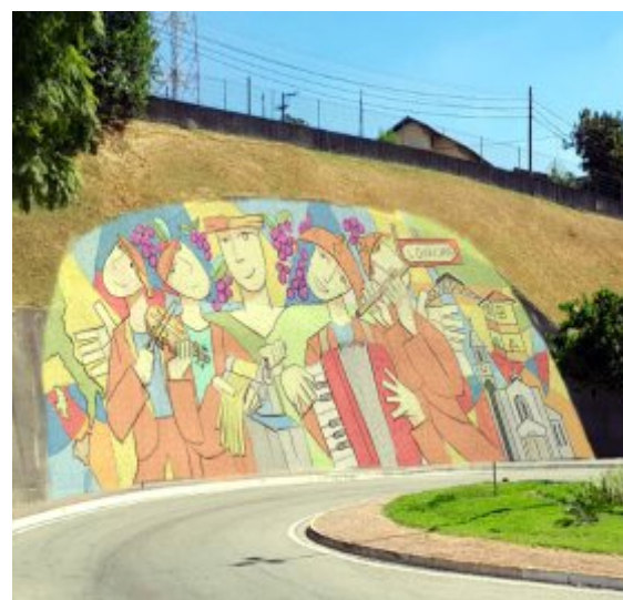
Simulação da obra finalizada

Suas dimensões impressionantes vão permitir que seja avistado pelos mais de 30.000 usuários diários deste trecho da Rodovia Anhanguera, aguçando o interesse turístico cultural, ao mesmo tempo que envolve os transeuntes locais despertando a curiosidade, por conta da novidade artística e assim democratizando o acesso cultural da população.